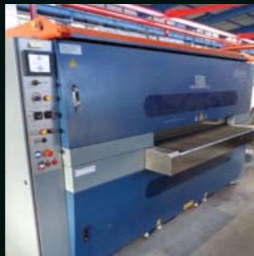
Finition / Ébavurage